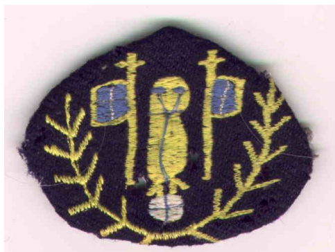
Το πρώτο έμβλημα του Ελληνικού Γυμνασίου Ριζοκαρπάσου

Το γυμνάσιο στεγάζεται στο πρώην Δημοτικό Παρθεναγωγείο και το Δημοτικό μαζί με το Νηπιαγωγείο στεγάζονται στο πρώην Δημοτικό Αρρεναγωγείο. Το κτίριο του Γυμνασίου Ριζοκαρπάσου χρησιμοποιείται από το κατοχικό καθεστώς για δημοτικό όπου φοιτούν τα παιδιά των εποίκων.