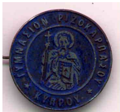
Το νέο Έμβλημα του Γυμνασίου Ριζοκαρπάσου με την εικόνα του ευεργέτη του Απ. Ανδρέα. Το τοποθετούσαν οι μαθητές και οι μαθήτριες στο πέτο τους από το 1965.