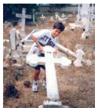
Οι σταυροί μας