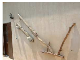
Ξυλάλετρο και ζυός